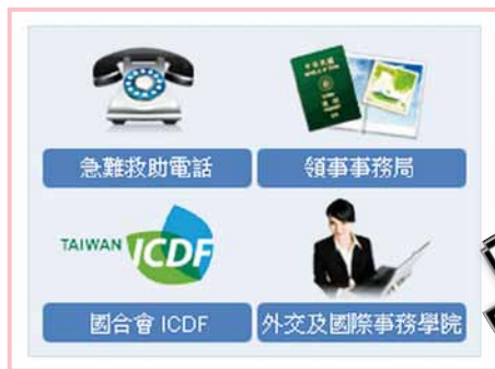
中華民國外交部網頁