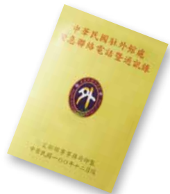
中華民國駐外館處 緊急聯絡電話暨通訊錄