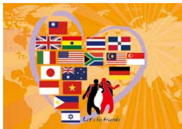
青年國際行動 All in One 活動

學校推動國際志工時，由於每年參與的學生都不同，因此參與者間彼此交流及經驗傳承甚為重要，應建立一套機制，如分享會等，讓經驗交流和學習順利進行，透過成果分享會，也讓志工有機會彼此交換心得，並從他人身上看到正面的能量，提升相關服務技能及專業，以展開下一次的志工之旅。青年署於每年年底辦理青年國際行動 All in One 成果分享會，邀請國內外講師、青年進行專題演講及分享服務心得，歡迎鼓勵青年踴躍參加。