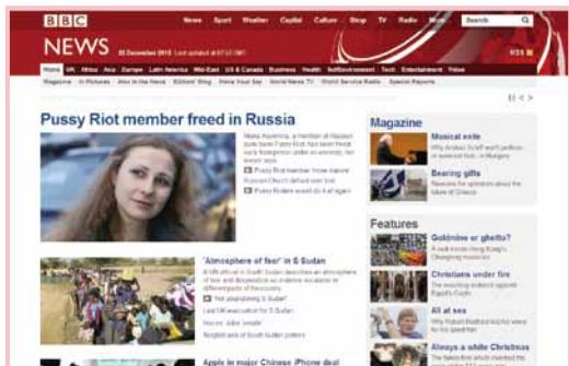
國際媒體 BBC 網頁

現今網路發達，請提醒學生在出發前 3 個月前，即可以透過網路閱讀前往服務地區的新聞媒體，瞭解當地相關訊息報導。怎麼獲取合適的新聞媒體呢？可以透過國際媒體 BBC News 網站 ( http://www.bbc.co.uk/news ) 中的各國簡介 (country profiles) 中查詢得知。