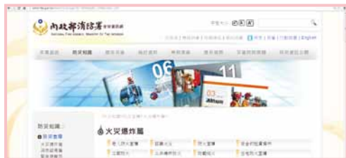
內政部消防署網站

另應請學生前往內政部消防署網站（ http://www.nfa.gov.tw/ ）查詢相關防災避難知識，以正確因應緊急災難之發生。